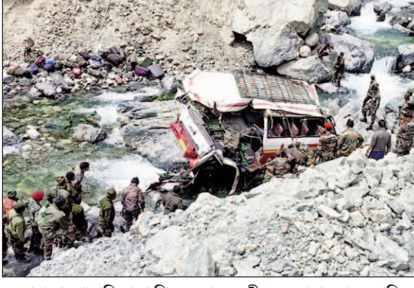
লাদাখের পাহাড়ি পথে পিছলে সায়ক নদীতে সেনাবাস পড়ল গাড়িয়ে

১ পাতার পর সহযোগিতা করা হবে। তিনি টাইটারে লেখেন, ‘লাদাখে বেদনাডায়ক বাস দুর্ঘটনায় আমরা আমাদের সাহসী সেনা জওয়ানদের হারিয়েছি। সাহসী পরিবারগুলোর সঙ্গে আছি। আশা করছি, জখম জওয়ানরা দ্রুত সুস্থ হয়ে উঠবেন। ক্ষতিগ্রস্তদের যত্নের সম্ভব সহযোগিতা করা হবে।’ বাংলার মুখ্যমন্ত্রী মমতা বন্দ্যোপাধ্যায় টাইটারে লেখেন, ‘লাদাখে সড়ক দুর্ঘটনায় আমাদের ৭ জন সেনা জওয়ানের মৃত্যুর দুঃখজনক খবরে গভীর বেদনান্বিত। কয়েকজন জখম হয়েছে। সাহসী জওয়ানদের প্রতি সমবেদনা রইল।’ কংগ্রেস নেতা রাহুল গান্ধী টাইটারে লেখেন, ‘আচমকই লাদাখে ভারতীয় সেনা জওয়ানদের দুর্ঘটনা খবর জেনেছি। সাহসী পরিবারগুলোর প্রতি গভীর সমবেদনা জানাই ও আমাদের জখম সেনা জওয়ানদের দ্রুত আরোগ্য কামনা করি।’ —পিটিআই